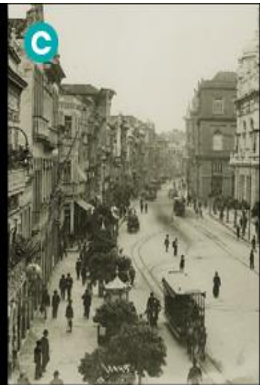
Vista da rua Primeiro de Março (antiga rua Direita), no município do Rio de Janeiro. Foto de cerca de 1920.

2- Observe as imagens acima e responda às questões.