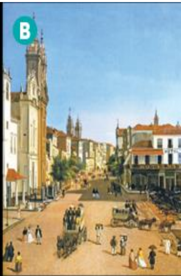
Emil Bauch. Vista da rua Direita, no Rio de Janeiro, cerca de 1890. Óleo sobre tela.