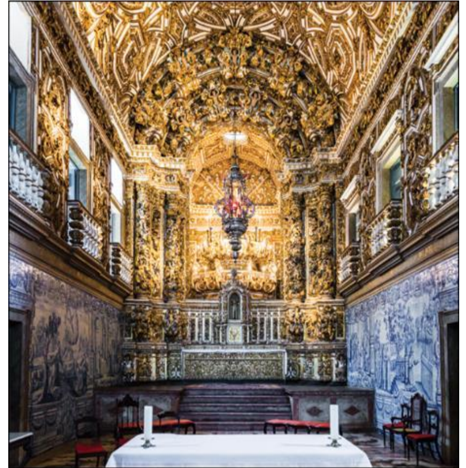
Interior da igreja de São Francisco, em Salvador, Bahia. Foto de 2014.

1-Na época em que o Brasil era colônia de Portugal, foram construídas muitas igrejas. Qual era a importância das igrejas nessa época?