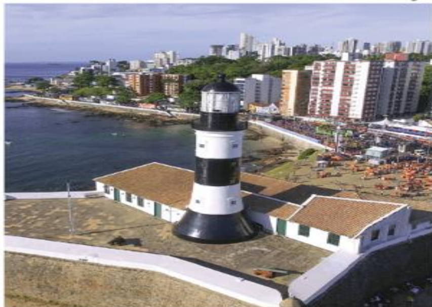
O forte de Santo Antônio da Barra, em Salvador, Bahia, foi construído na mesma época em que foram erguidas as primeiras casas da cidade. Foto de 2016.