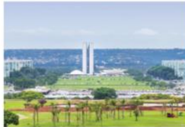
Congresso Nacional e Esplanada dos Ministérios, em Brasília, Distrito Federal. Foto de 2015.

Você conhece algum dos locais que aparecem nessas fotos?