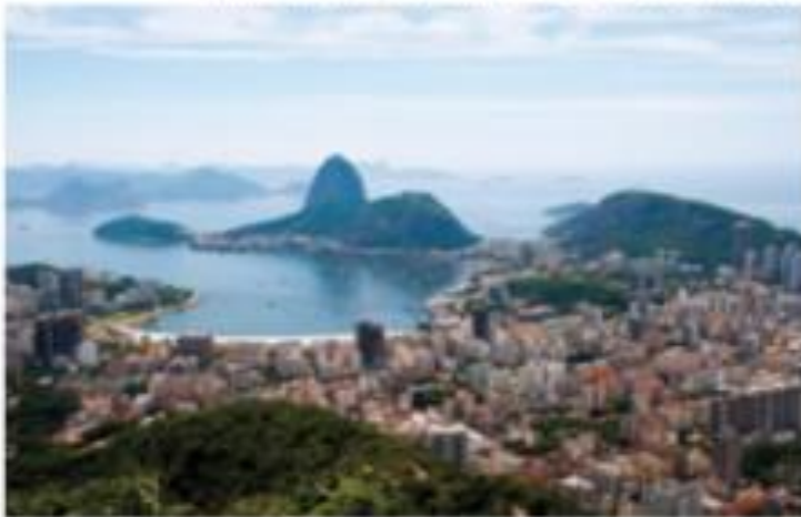
Vista do município do Rio de Janeiro, com Pão de Açúcar ao fundo. Foto de 2016.