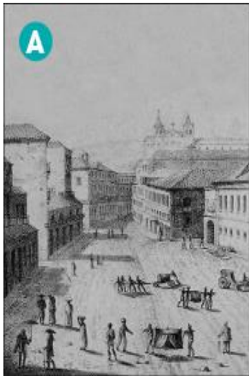
Godefroy Engelmann. Vista da rua Direita, no Rio de Janeiro, cerca de 1820. Gravura.

Quase cem anos depois, em 1904, uma reforma modificou novamente a cidade. Muitas construções foram demolidas. Largas avenidas, iluminação pública e rede de esgoto fizeram parte das mudanças.