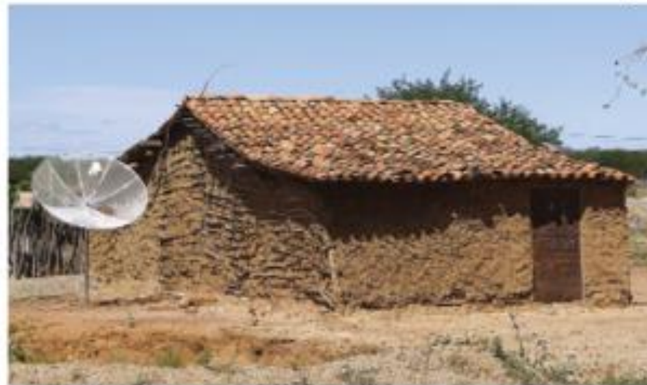
Habitação de pau a pique em Casa Nova, Bahia. Foto de 2014.

1 Escolha as palavras que completam corretamente cada frase.