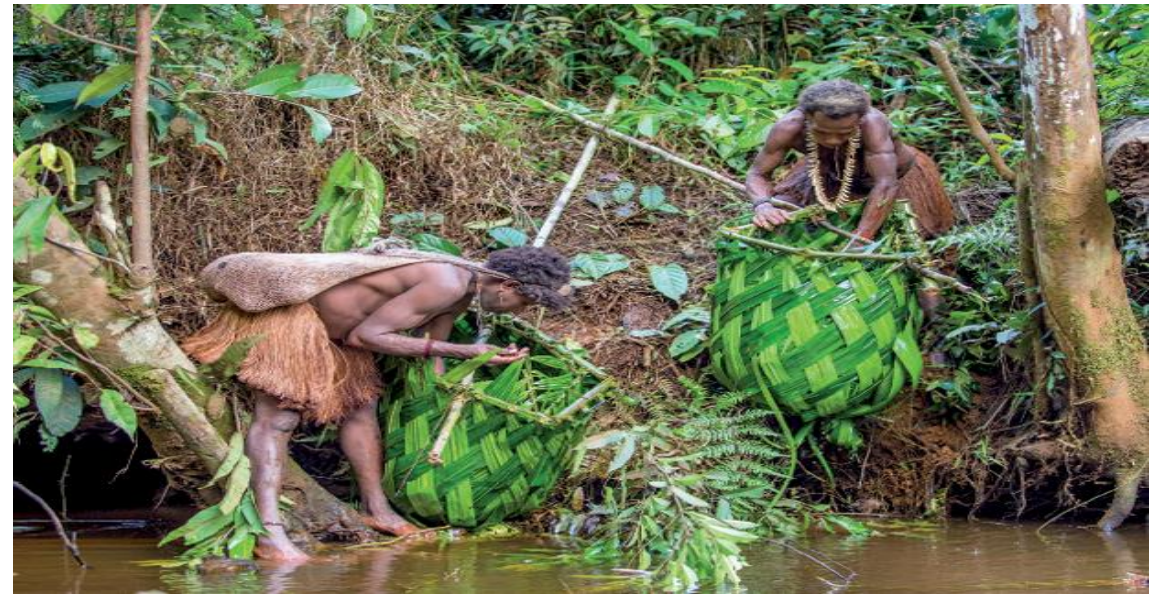
Mulheres do povo Korowai manuseando cestos, durante atividade de pesca. Papua, Indonésia. Foto de 2016.

Entre as tradições cultivadas pelas famílias estão os mitos, as lendas e os ditados, passados de geração a geração.