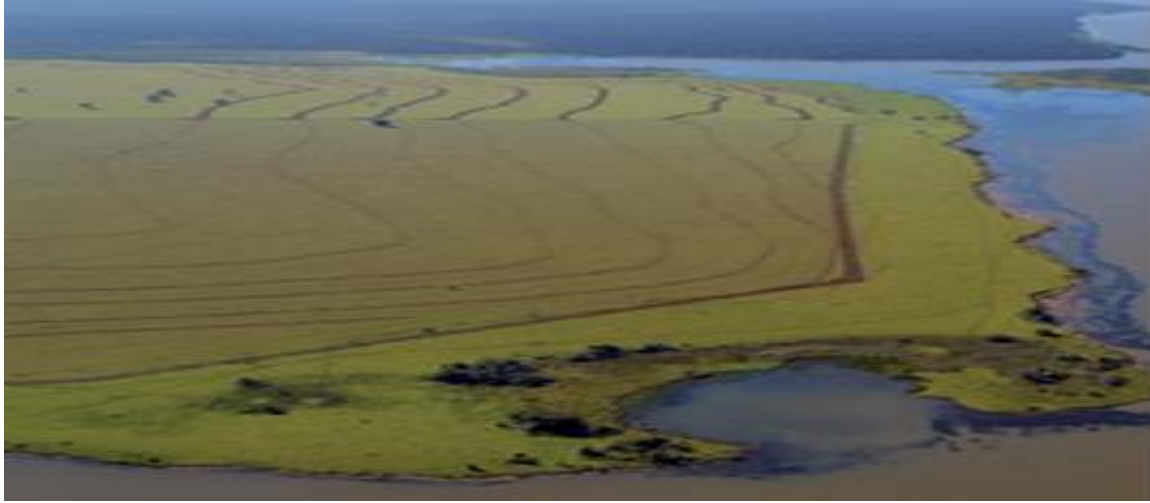
Área desmatada para pastagem na região do Pontal do Paranapanema, São Paulo. Foto de 2007.