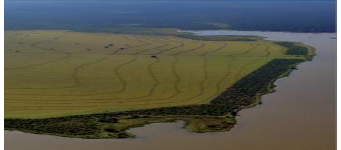
Reflorestamento de uma faixa de terra nas bordas da mesma área. Foto de 2011.

As florestas brasileiras são um patrimônio do povo. Mas já foram bastante desmatadas para variadas atividades econômicas e, por isso, muito se perdeu. No entanto, é possível fazer o contrário, ou seja, reflorestar, semeando os tipos de plantas que existiam na vegetação original.