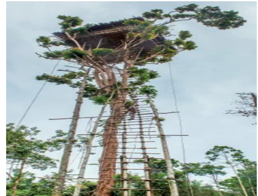
Os Korowai têm grande habilidade para subir até suas casas. Papua, Indonésia. Foto de 2016.