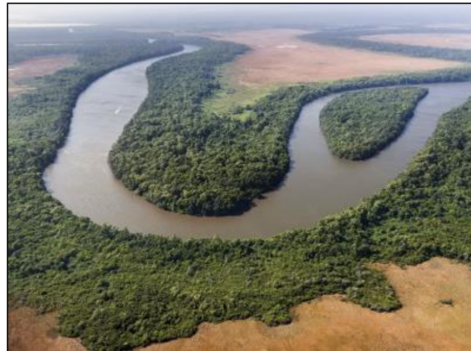
Vista aérea do rio Preguiças, mostrando a vegetação ao longo das margens. Barreirinhas, Maranhão. Foto de 2015.

A cobertura vegetal nas margens de rios e lagos recebe o nome de mata ciliar . Ela protege os rios como os cílios protegem os olhos. Essa mata é fundamental para evitar que materiais do solo se acumulem no rio e que o lixo gerado pelos seres humanos chegue até as águas. Vale lembrar também que as matas ciliares abrigam uma fauna diversificada.